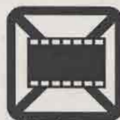
感光したフィルム