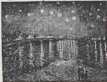
白丸セー、美術画 提供

地球の大気に関係のない星々は、年変動はほとんどなく、まわりと季節を刻んでいます。私も本番、ハカス座が宵の空、そろそろ天頂です。