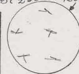
←折り紙トンボも いたっていました

〒270-1422 千葉県白井市復1148-8 白井市文化センター・プラネタリウム 電話 047-492-1125 FAX 047-492-8016 e-mail:planet@center.shiroi.chiba.jp URL:http://www.center.shiroi.chiba.jp/planet/