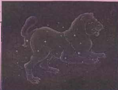
イラスト 高柳 哲也

季節とサクラの開花やウグイスの鳴き声で感じるだけでなく、夜空の星座や星の並びでも「春だな」を感じることもできます。今ごろの時期、おなじみの「北斗七星」が宵の時間ドーンと輝いています。さあ、「北斗」でも季節を感じてください!