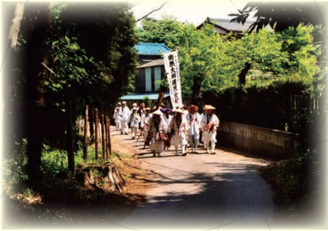
東葛印旛大師巡行風景（平成16年） 白井市富塚

四国で行われる遍路。その派生である新四国巡礼は全国各地で行われています。白井市には新四国巡礼のためのお寺やお堂がいくつも所在しており、霊場と呼ばれる巡礼のための聖地とも言うべき場所が5つもあります。本企画展ではそのような白井市にある5つの霊場を紹介すると共に、白井で活躍した、巡礼にまつわる人物を紹介していきます。