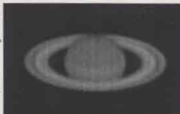
土星写真 平野岳史

夕方、南西の空 に輝いています。 近くにさそり座 のアンタレス スが赤く輝 いています。