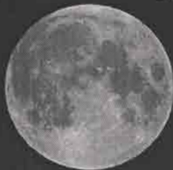
2015年 最大の満月 9月28日 11時51分 視直径 33'28.34秒