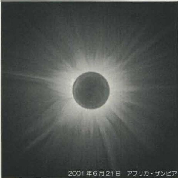
2001年6月21日 アフリカ・ザンビア

連日「新型コロナウイルス」の文字がニュースで流れていますが、本来、「コロナ」とは王冠、花冠を意味する言葉です。星座の「かんむり座」は「 Corona Borealis （北を意味する）」といます。また、そこから「コロナ」は太陽を取り巻く外層大気も指します。普通は太陽の表面が放つ強い光にかき消され見ることはできませんが、皆既日食時には肉眼で見ることができます。また、コロナグラフという方法を用いると、日食時でなくても見ることができます。コロナの形は太陽の活動期（約11年周期）によって変化し、極大期には右上写真のように全方向放射状に広がり、極小期には右下写真のように有翼日輪型※の横長のコロナになります。※太陽に翼が生えたようなコロナが双方向に現れる型