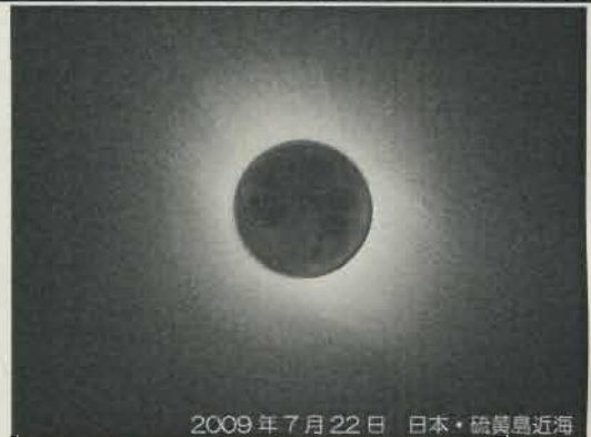
2009年7月22日 日本・硫黄島近海

太陽は中心部の核が最も温度が高く約1570万℃。中心核から表面に上昇するにつれ温度が下がり、太陽表面の光球面は約6000℃ですが、コロナは約100万℃と一気に上昇します。長年「コロナ加熱問題」として疑問視されてきましたが、コロナの熱は太陽の核由来でなく、太陽表面の磁場の影響を受けていることが日本やアメリカの太陽観測衛星によって、明らかになりつつあります。