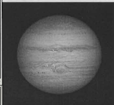
2023年2月25日18:00の木星の衛星の位置 観望: ステラナビゲーターVer.11/観アストロアーツ/観アスキー