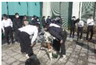
大山口中学校 3年生 太陽黒点を観望中

毎年 12 月を中心に、市内すべての中学校 3 年生が、天体の学習にプラネタリウムを訪れます。ドームの中で 1 時間、地球と宇宙について学ぶと共に、センター中庭で望遠鏡を使って太陽黒点を観望します。