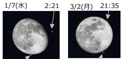
1:16 20:30 作図参考：ステラナビゲーターVer.12/腕アストロアーツ

1 等星は 21 個ありますが、月に隠される可能性がある 1 等星は、スピカ、アンタレス、アルデバラン、そしてレグルスの 4 つのみです。