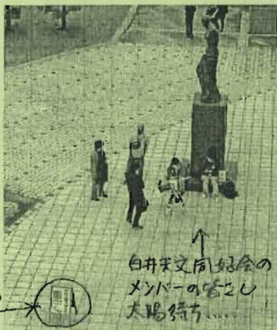
白井天文同好会の メンバーの皆さん 太陽待ち...

2023年に入ってから星 見会望遠鏡観望日は 4打数1安打(1Aのみ)。 2月から4月は、ドーム内 解説です。29年間の星 見会開催年月が晴れの 当たり年であれば、雨の 年もありました。